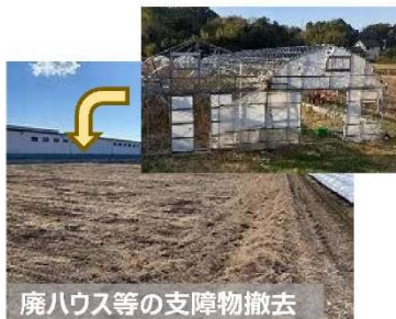
【荒廃農地の支障物撤去】