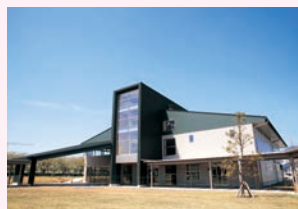
▲児童福祉施設(親子交流館)