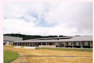
▲学校教育施設(伊良湖岬小学校)