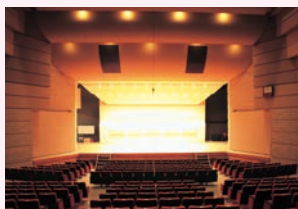
▲文化施設(田原文化会館)

国や県、市町村などが所有する施設。市民館や学校、文化会館などの建築物(いわゆる「ハコモノ」と呼ばれるもの)だけでなく、道路や橋、上下水道などのインフラ施設も含め公共施設と捉えています。