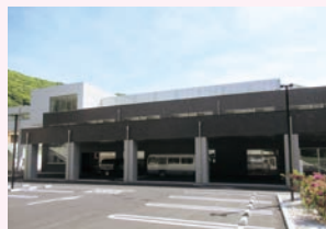
▲衛生施設(田原斎場)