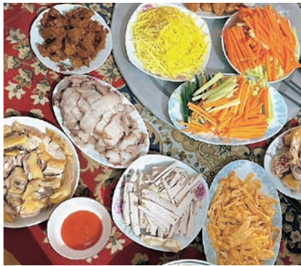
▲今年は田原でテトを過ごしました

春節中は、家族や友人を訪ね、幸運を祈り、喜びを分かち合います。これらは、新たなつながりを築き、過去の思い出と未来への希望を分かち合う機会です。初詣や花火といった伝統的な遊びも忘れません。夜には家族で新しい年の計画を話します。私は温かさや愛情に満ちたこの時を、いつも心に刻んでいます。