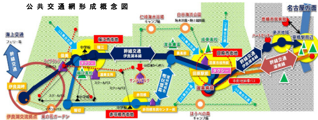
公共交通網形成概念図