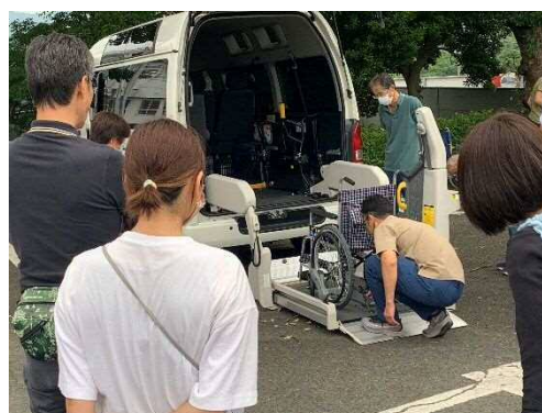
運転実技講習の様子