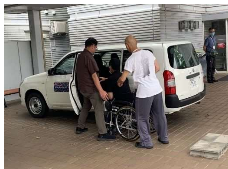
運転実技講習の様子