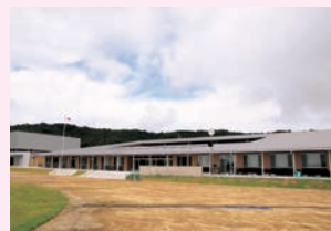
▲学校教育施設(伊良湖岬小学校)