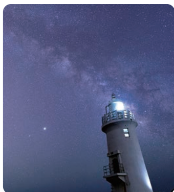
▲夏には天の川も見られますよ

また、伊良湖岬灯台は人気の星空撮影スポットでもあるので、月明かりが弱い日や時間帯を狙って、ぜひ星空の撮影も楽しんでください。