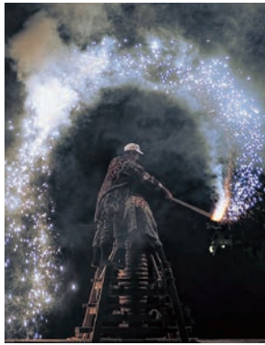
▲大筒は迫力がありました！

さて唐突ですが、皆さんは田原市が好きですか？今月号の特集にもあるとおり、田原市は市制20周年を迎えました。少しずつ住みやすい街になってきていると感じます。冒頭の田原祭りを取って見ても人と人との繋がりをを感じる田原ならではの行事です。人が暖かく優しいさの輪ができる素晴らしい街だと感じます。自然も豊かで農作物も美味しく、四季折々の風景が色鮮やかに街を染めてくれます。