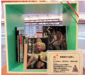
▲「私の本棚」イメージ

田原市図書館と豊橋市図書館で「みんなでつくる本の街」を開催します。両市ゆかりの著名人や市民の皆さんに選んでもらった本で「私の本棚」を作り、これを並べて「本の街」を完成させます。