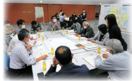
▲まちづくり市民会議の様子