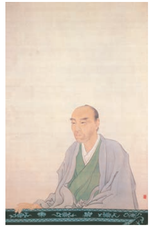
▲重要文化財 渡辺華山像 (椿椿山筆)

像が見られるのは2年以上先となる見込みです。この展示が華山像との当面の別れとなりますので、ぜひ多くの皆さんにご覧いただきたいと思っています。