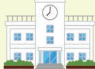
小学校や市民館などの指定避難所