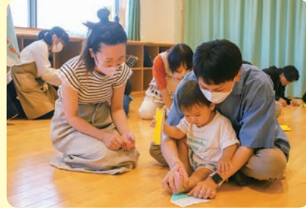
▲前回のとおとうさんとあそぼう!(紙飛行機づくり)