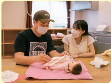
▲オムツ交換を体験するパパ