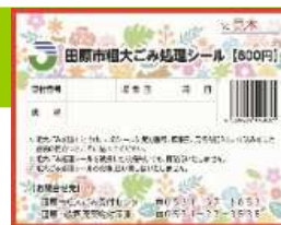
粗大ごみ処理シール