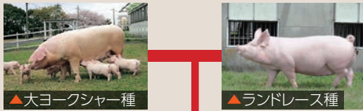
▲大ヨークシャー種