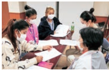
▲にほんご教室の様子

そのうちの1つ、NPO法人たはら国際交流協会では、ボランティアが、外国人と交流をしながら日本語や日本文化、地域での生活マナーなどを伝えています。