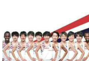
中央発條(愛知県名古屋市)