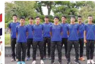
御殿場滝ヶ原自衛隊(静岡県御殿場市)