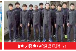
セキノ興産(新潟県見附市)