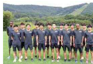
愛知製鋼(愛知県東海市)