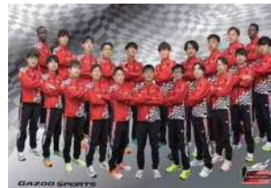
トヨタ自動車(愛知県田原市)