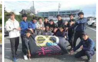
Infinity Athlete & Running Club(愛知県刈谷市)