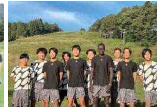
愛三工業(愛知県大府市)