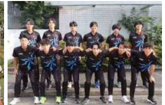
トーエネック(愛知県名古屋市)