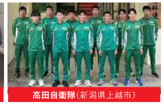
高田自衛隊(新潟県上越市)