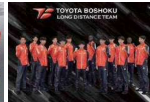
トヨタ紡織(愛知県刈谷市)