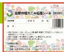
粗大ごみ処理シール