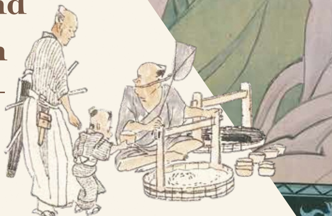
重要文化財 渡辺華山筆「一掃百態図」(部分)より 文政元年(1818) 田原市博物館蔵

Donald Keene and Watanabe Kazan -The Wisdom of Kazan-