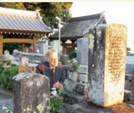
華山の墓を参拝するドナルド・キーン(田原市城宝寺) 2017年10月撮影

日本文化研究の第一人者であり、田原市博物館名誉館長(2017～2019)を務めたドナルド・キーン(1922～2019)は、昨年生誕100年を迎えました。コロンビア大学在学中に、アーサー・ウェーリ訳『源氏物語』に魅了されたキーンは、長い年月をかけて、日本文学や日本文化について研究を積み重ね、多くの著作を残しました。著作の中には、渡辺華山(1793～1841)について書いたものもありました。