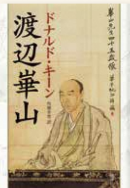
ドナルド・キーン著、角地幸男訳 『渡辺華山』2007年 新潮社

田原市制20周年・田原市博物館開館30年・渡辺華山生誕230年を記念する本展では、日本学者としてのキーンの足跡やその功績、キーンと田原市の交流をたどります。そして著書『渡辺華山』で取り上げた華山の名品を紹介します。