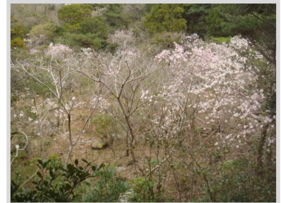
藤七原湿地植物群落

● 黒河湿地植物群落：県の天然記念物に指定されています。湿地を囲むようにシデコブシが自生し、湿地内の木道から花を間近に見ることができます。湿地には貴重な植物が多く、初夏から晩秋にかけて様々な花が咲きます。