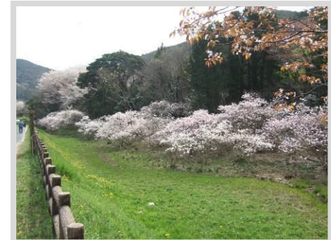
伊川津のシデコブシ