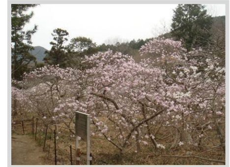
椀のシデコブシ自生地