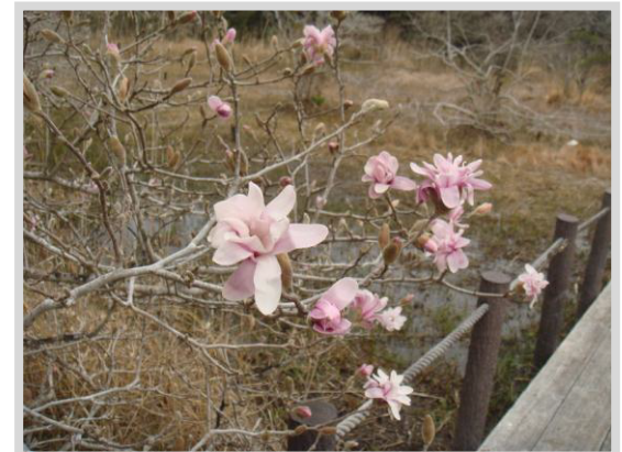
黒河湿地植物群落