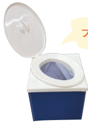
プラスチック製の災害用トイレ