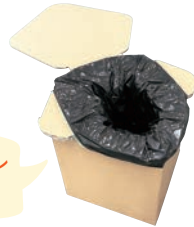
ダンボール製の災害用トイレ と携帯トイレの使用例

※携帯トイレ(便袋)は、既設のトイレや 災害用トイレにかぶせて使うこともできます。