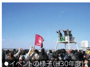
●イベントの様子(H30年度)

当日はカキとアサリ汁の食べ比べやキッチンカーなど、両地域の美味しい特産品が楽しめます。ほかにも、景品付き餅投げなどを行います。ぜひ、ご家族ご友人とお越しください。