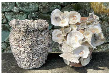
貝などがびっしりついたたこつぼ(昭和時代、六連町で使用)