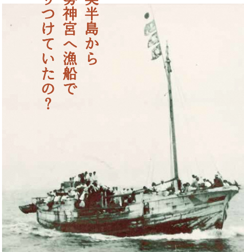
伊勢神宮へ向かう漁船(昭和時代前期、伊勢・神社港みなとまち館蔵)