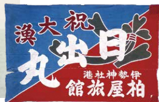
伊勢神宮近くの宿屋から贈られた大漁旗