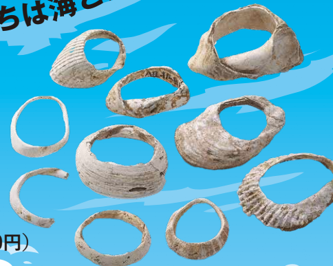
縄文人のアクセサリだった オオツタノハ、ベンケイガイなどの貝輪 (縄文時代晩期、伊川津貝塚ほか)