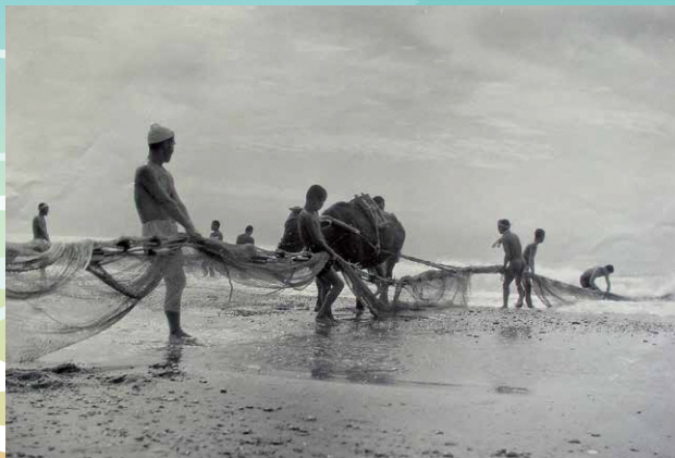
地引網のようす (昭和時代初期、鈴木政一氏撮影/原版・個人蔵)