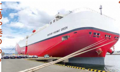
トヨタ自動車田原工場ヤード(現代)