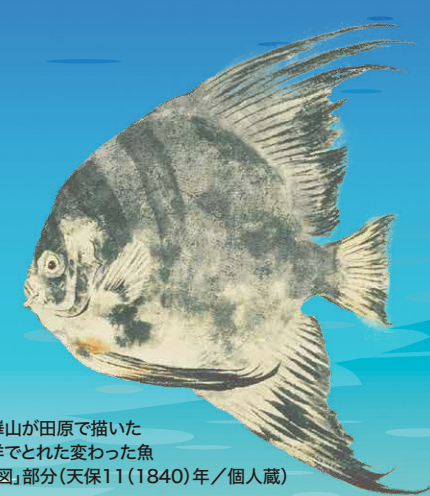
渡辺崋山が田原で描いた 太平洋でとれた変わった魚 「異魚図」部分(天保11(1840)年/個人蔵)