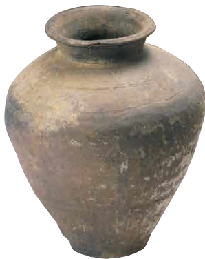
日本の各地に運ばれた渥美半島産のやきもの(鎌倉時代初期、坪沢10号窯)