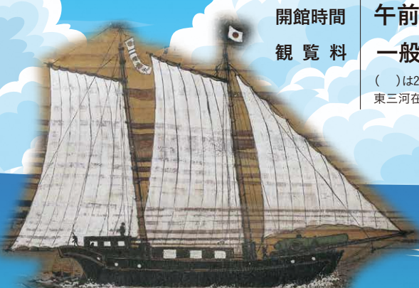
井上親画 田原藩が建造した西洋式帆船 順応丸図