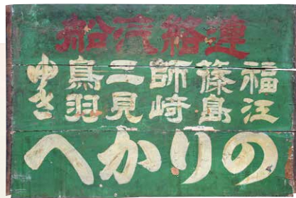
福江・鳥羽等方面行き汽船看板(大正時代、蒲郡市博物館蔵)