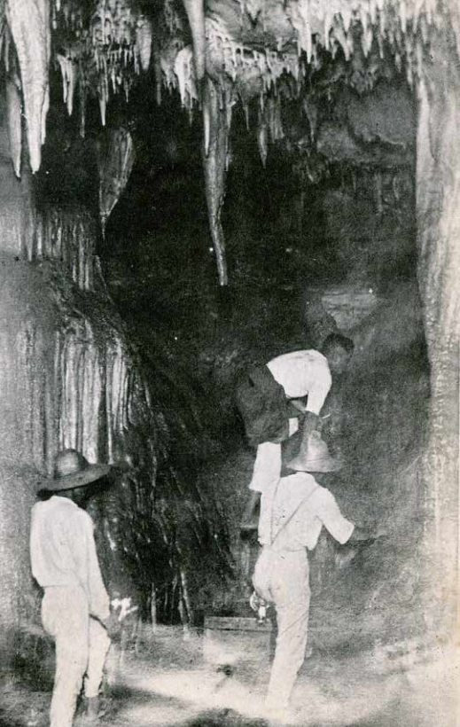
田原市白谷町にあった鍾乳洞(昭和時代初期)

この展覧会では渥美半島の人たちと海の間接の歴史を「海から広がる」をテーマに、過去から現在まで見ていきます。渥美半島と海のお話をお楽しみください。