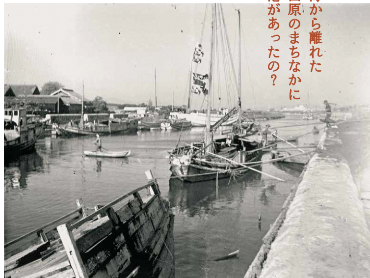
旧田原港(昭和時代初期)