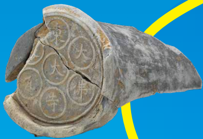
東大寺の屋根をふくために焼かれた瓦 (鎌倉時代初期、伊良湖東大寺瓦窯跡)