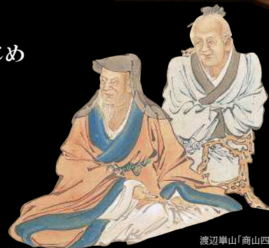
渡辺崋山「商山四皓(部分)」

開館時間 9時～17時(入館は16時30分まで) 休館日 月曜日(月曜日が祝日の場合はその翌日) 会場 田原市博物館 観覧料 一般 310円(240円) 小中学生 150円(120円) ※( )は20名以上の団体料金 ※東三河の小中学生は、ほの国こどもパスポート提示で無料 主催 田原市博物館