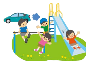
道路交通と分離した 安全な公園の整備に努める

道路交通から隔離された安全な子供の遊び場不足を解消するため、都市公園等の整備を推進し、路上遊戯等による交通事故の防止に努める。