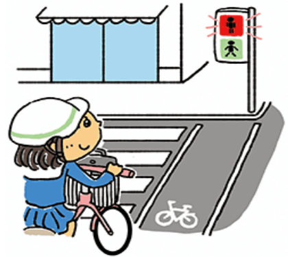
安全な自転車利用の技能を身につける