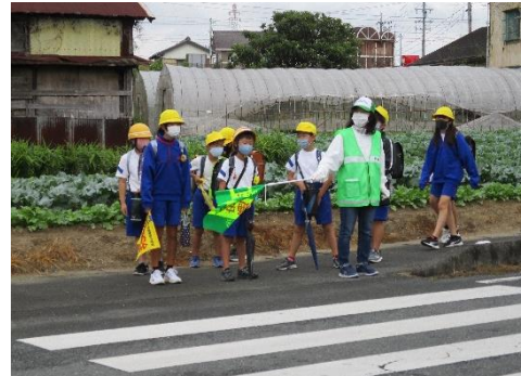
地域の見守りボランティアによる活動