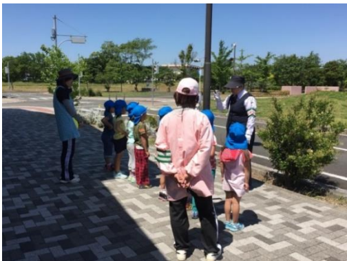
田原市交通公園を利用した交通安全教室