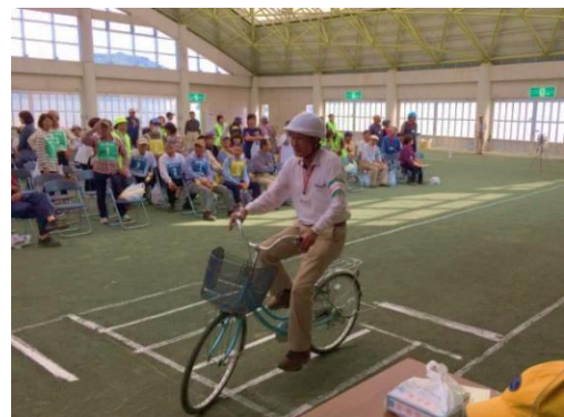
高齢者自転車大会

※自転車乗車用ヘルメットの着用を努力義務とすることや自転車損害賠償責任保険等の加入を義務とすること等を規定している。