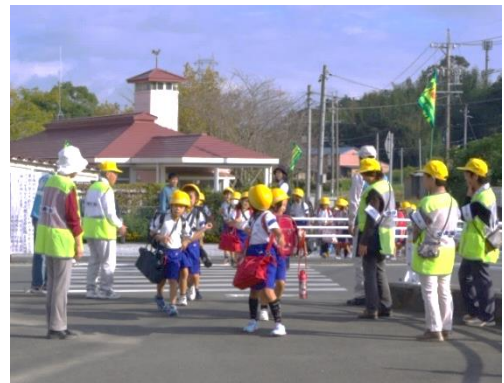
子供の下校を見守るボランティア団体