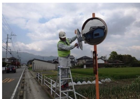
カーブミラーの点検