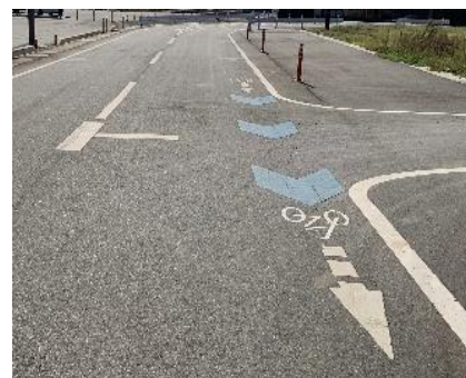
自転車のピクトグラムや矢羽根の路面標示