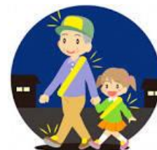
視認性を高める反射材

夜間における視認性を高め、歩行者等の事故防止に効果が期待できる反射材用品や自発光式ライトの普及を図るとともに、積極的な広報啓発を推進する。