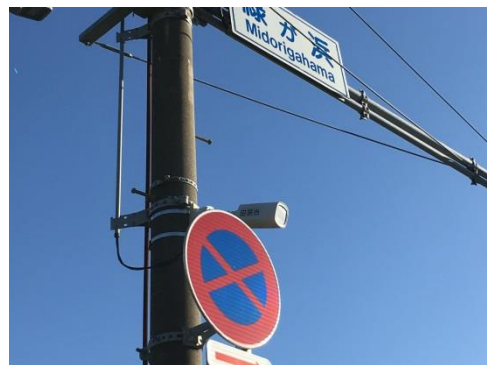
まちかど防犯カメラ