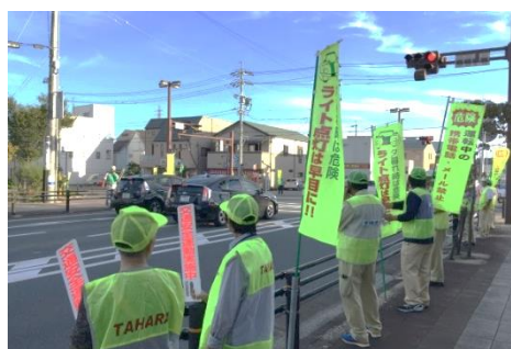
市民参加による街頭ボランティア活動

(e) 田原市外から来訪する観光客やサーファー等を対象とするなど、時節ごとの交通事情や対象にあわせたキャンペーンや啓発活動を実施する。