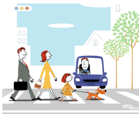
保護者も共に交通ルールを学び、守る