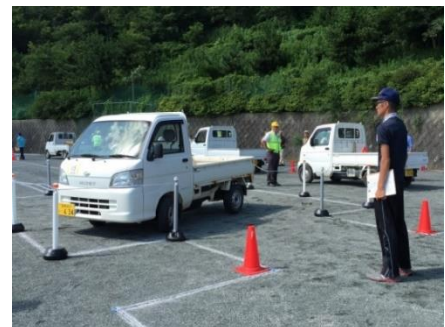
高齢者軽トラック大会