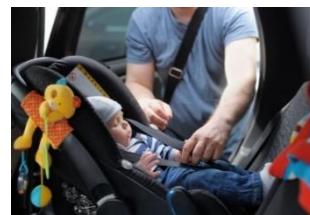
体重や年齢にあった着用の周知を図る

チャイルドシートの着用効果及び正しい着用方法について、保育園・認定こども園等と連携し、保護者に対する効果的な広報啓発に努め、正しい着用の徹底を図る。