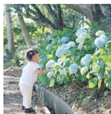
yu_uko1031 サンテパルクたはら