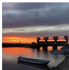
hajime141 免々田川・河口右岸堤防