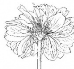
太田桜構造図 (太田洋愛画)

441-3421 愛知県田原市田原町巴江11-1 ☎ 0531-22-1720 https://www.taharamuseum.gr.jp