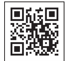
Kode sekunder Navigasi Vaksin Virus Corona