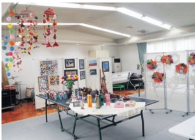
▲手作り作品の展示