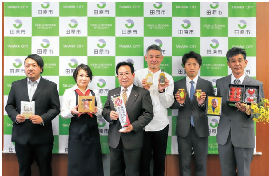
▲認定された品を持つ事業者たちと山下市長(左から3人目)