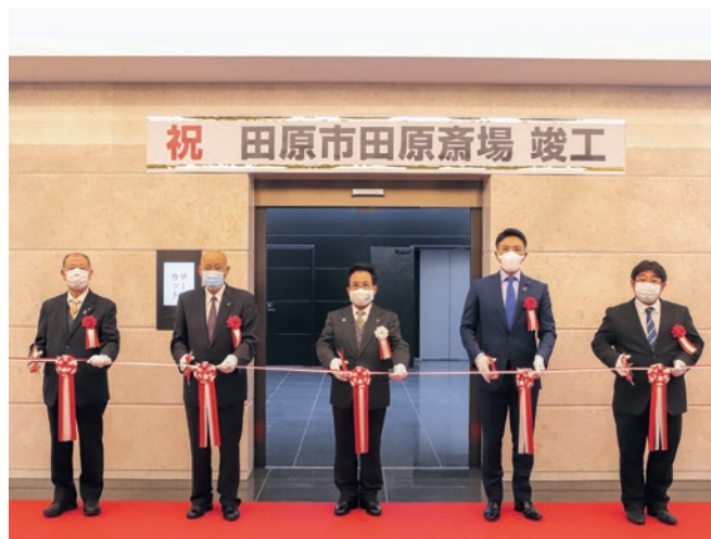
▲テープカットの様子

田原斎場の新しい火葬棟が完成し、現地で竣工式を行いました。新火葬棟は、最新の排煙、集じん設備を導入した火葬炉(人体炉5基、動物炉1基)やキッズスペースなど旧火葬棟にはなかった設備も整備しました。供用開始は4月1日からで、今後は旧火葬棟の解体や駐車場の整備を進めます。