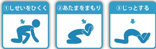
※シェイクアウトの方法

緊急地震速報を知った後、強い揺れが来るまで、わずかな時間しかありません。自分の命を守るために、「姿勢を低く」「頭を守り」「じっとする」という3つの動きを身につけましょう。