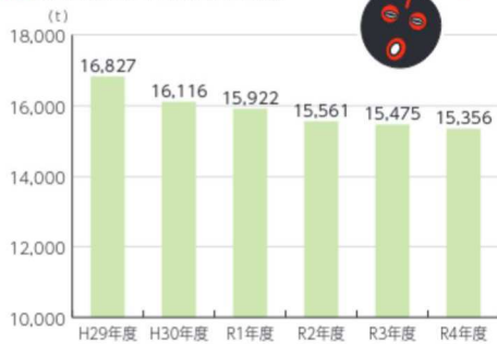
●炭生館ごみ量(年度別)

皆さんのごみの減量・分別に対するご理解とご協力のおかげで、炭生館に運ばれるもやせるごみの量は減ってきています。皆さんのご協力に感謝いたします。