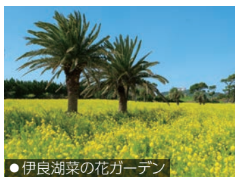
●伊良湖菜の花ガーデン

菜の花まつり会場から足を伸ばし、他の体験プログラムにもぜひ参加して、渥美半島の魅力を体感してみてください。