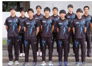
トーエネック(愛知県名古屋)