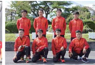
御殿場滝ヶ原自衛隊(静岡県御殿場市)