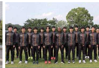
愛知製鋼(愛知県東海市)