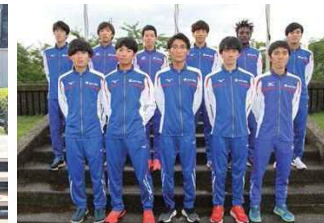
セキノ興産(新潟県見附市)