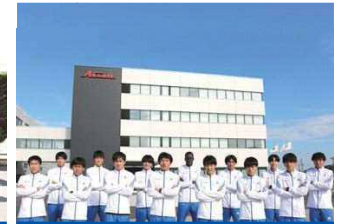
愛三工業(愛知県大府市)