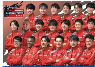
トヨタ自動車(愛知県田原市)