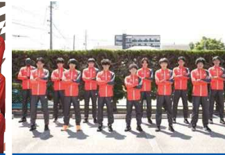
トヨタ紡織(愛知県刈谷市)