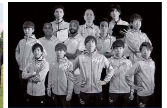
中央発條(愛知県名古屋市)