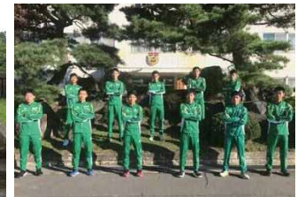
高田自衛隊(新潟県上越市)