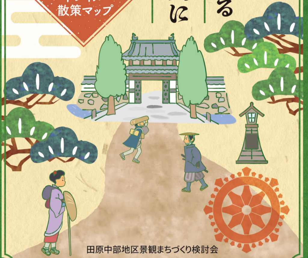
田原中部地区景観まちづくり検討会