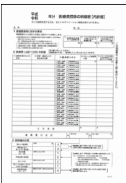
医療費控除の明細書を事前作成してください