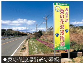
●菜の花浪漫街道の看板

本市では、この道を舞台に、市民・団体・企業・行政が協働で、美しい道づくりや、渥美半島の自然・観光・歴史・文化などの地域資源を活かした観光振興や地