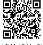
▲たはら巡り〜な HPのQRコード

「渥美半島を暮らす旅」をコンセ プトに本市ならではの48の体験プ ログラムを集めた観光体験博覧会 「たはら巡り〜な」を令和2年3月 31日まで開催しています。電照菊ナ イトツアーや農業体験、凧づくり 体験など、巡って楽しむプログラ ムがいっぱいです。市民の皆さん の参加も大歓迎です。体験や交流 を通して、渥美 半島の魅力を再 発見してはいか がでしょうか。