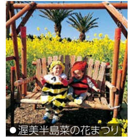
●渥美半島菜の花まつり

には「た はら巡り 〜な」の プログラ ムの一つ である着 ぐるみ体験と菜の花狩りを実施し ています。