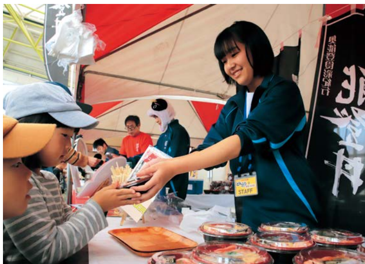
▲福江高校の生徒がボランティアスタッフとして参加し、笑顔で接客したり、会場整理をしたりしていました