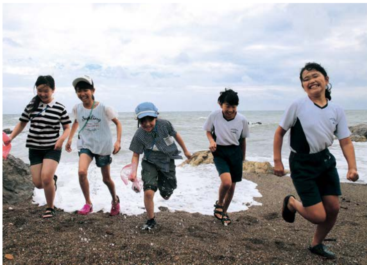
▲海岸で楽しそうに遊ぶ両校の児童たち