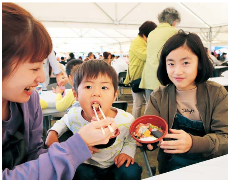
▲ご当地丼をおいしそうに頬張る来場者