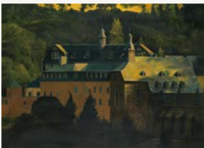
「輝風」平成10年 第75回春陽展