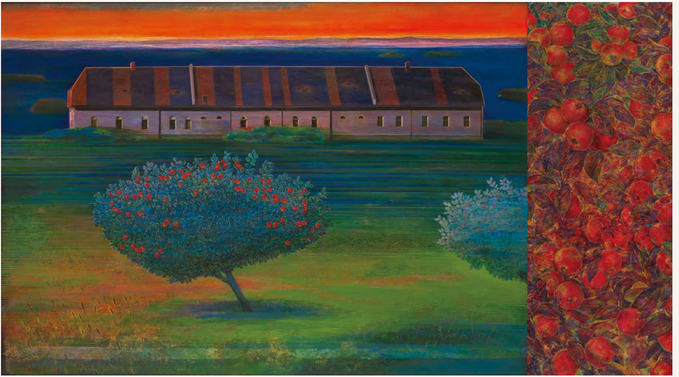
「HORIZON」平成12年 第77回春陽展