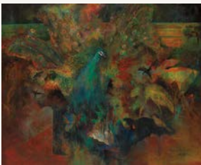
「とりのはなし」昭和44年 第46回春陽展