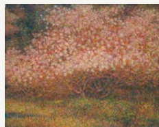
「半島の花(伊川津のシデコブシ)」 平成25年 第28回風景の会絵画展