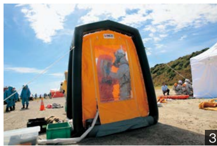
1.現場指揮本部にて消防・警察・自衛隊が情報共有／2.東三河各消防本部と協力し傷病者を搬送／3.汚染された活動隊員の除染作業