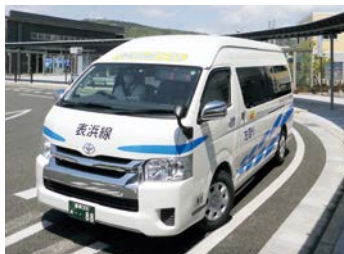
▲ぐるりんミニバス(田原駅前バス停)

て便利で使いやすいものにするためには、今、多くの方が利用して、みんなが公共交通を維持していくことが必要なのです。