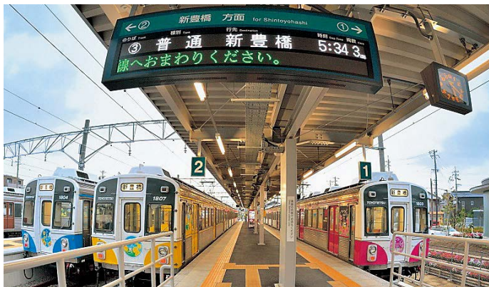
▲豊橋鉄道渥美線(カラフルトレイン)

しかし、マイカー社会の進展により、バスや電車などの利用は全国的に年々減り続け、運行の継続が困難な状況になっており、本市でも例外