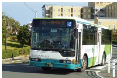
▲豊鉄バス 伊良湖本線・支線

て便利で使いやすいものにするためには、今、多くの方が利用して、みんなが公共交通を維持していくことが必要なのです。