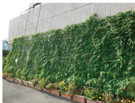
▲衣笠市民館の緑のカーテン