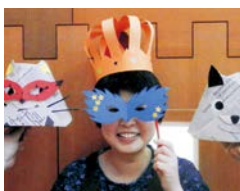
▲セルフ工作のイメージ