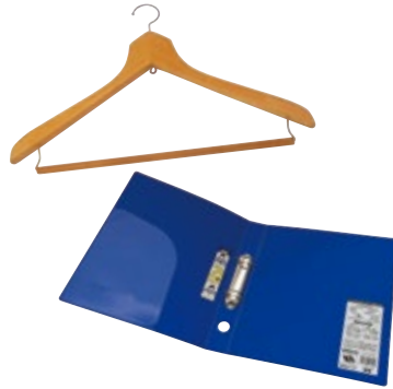
分解が必要なもの