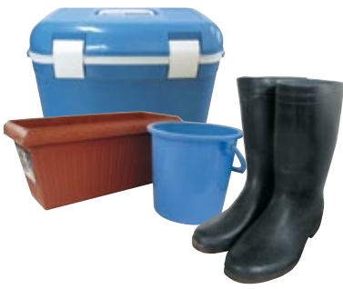
30cm四方より大きく45ℓまでの 指定袋に収まるもの

30cm四方より大きく、45ℓまでの指定袋に収まる燃える素材のもの 又は金属等と一緒にあって分解が必要なもの。※資源ごみを除く