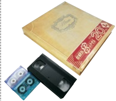
その他特別なもの

伸ばすと30cm四方より大きい:テープ・ひも等 分厚くて燃えにくい:厚いアルバム