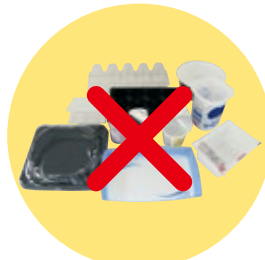
プラマークの付いた プラスチック容器・包装