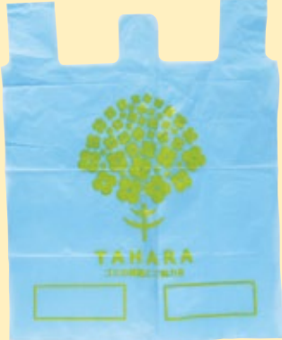
▲田原市家庭系有料化指定ごみ袋