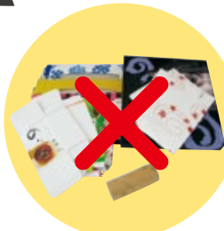
雑がみ (紙箱、包装紙、はがき、封筒、ちらしなど)