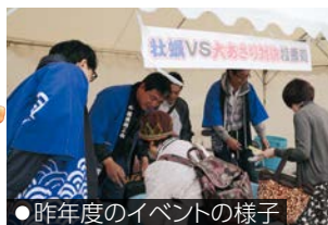
●昨年度のイベントの様子

当日は、ステージイベントや物産販売などが行われ、キャベゾウ・かいくんの他、鳥羽市のご当地バーガー」と「ばーがー」のキャラクター、トバくん・トパティちゃんがいイベントを盛り上げます。